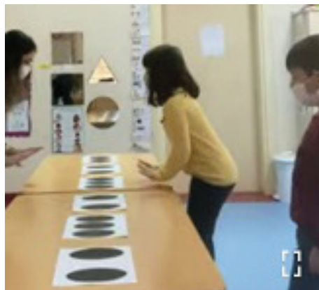
Слика 7. Извођење ритмичких фигура на столу помоћу графике