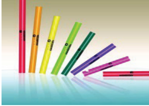
Слика 6. Музичке цеви

из Корунковићеве збирке погодне су за свирање на мелодијско ритмичким инструментима као што су музичка звона и думвекеру (слика 6) због тога што се слогови поклапају са нотним вредностима (један слог – један тон) и нема мелизматике.