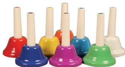
Слика 5. Музичка звона

наставникову акордску пратњу на клавиру изводе песму певањем и свирањем (дуже трешење инструмента производи половине које се изводе као тремоло). Ученици се затим поделе у две групе: прва група свира мелодију песме, а друга хармонску пратњу (истовремено свирање акордских тонова на музичким звонима).